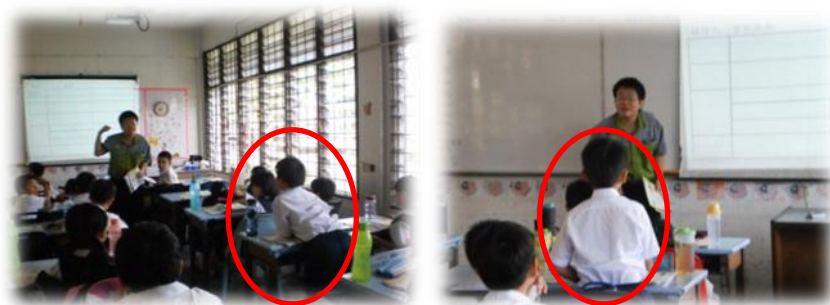
图二 学生上课反应和表现

勾选表中第六题：“所运用的教学法能增强学生学习（理解课文）”为总结，三位研究对象的表现显示图表法提升学生积极性，并能运用图表来理解课文。这也证实了张力（2007）指出图表法有直观性，助于提升学生学习兴趣，易于理解的教材。图二显示学生都专心听课。从他们的回答中，可见他们能通过图表填充式感兴趣，也自主回答问题，以加强对课文理解能力。